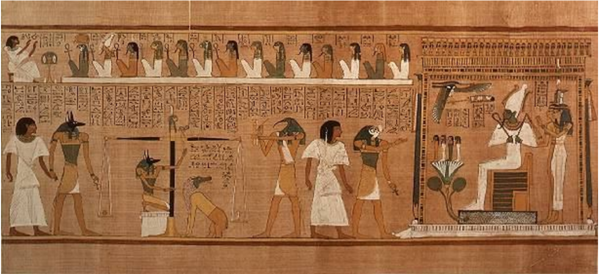
Papiro del "Libro de los Muertos", que representa el Juicio de Osiris