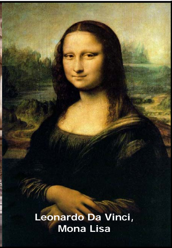
Leonardo Da Vinci, Mona Lisa